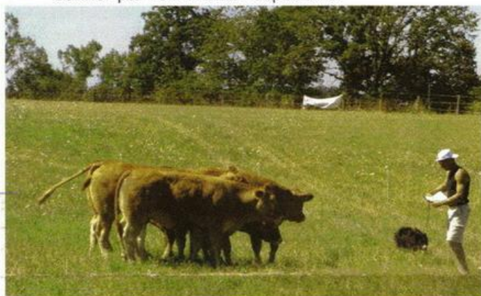
Pour les chiens, nous devons mettre en place des tests d'évaluation.

↳ l'élevage des animaux de rente nous conduit à gérer l'animal sous deux aspects importants: son adaptation au système de production, son élimination le cas contraire. Aujourd'hui, le chien échappe à cette dynamique; N'étant peu ou plus considéré comme un animal de rente, il est quasiment impossible de raisonner par l'élimination expéditive.