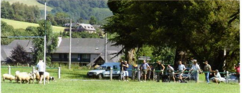
Une journée rencontre pour échanger sur le comportement des chiens.

La mobilisation de plusieurs éleveurs, utilisateurs de chiens pour l'organisation de deux concours qualificatifs puis de la Finale en 2005, a permis la création de l'APCT64 (Association pour la Promotion du Chien de Troupeau). L'association a organisé en 2006, trois démonstrations d'utilisation du chien sur Bovin et une journée rencontre à laquelle tous les participants aux stages de dressage étaient conviés.