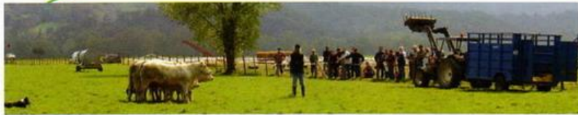
Des démonstrations pour promouvoir le chien en élevage bovin