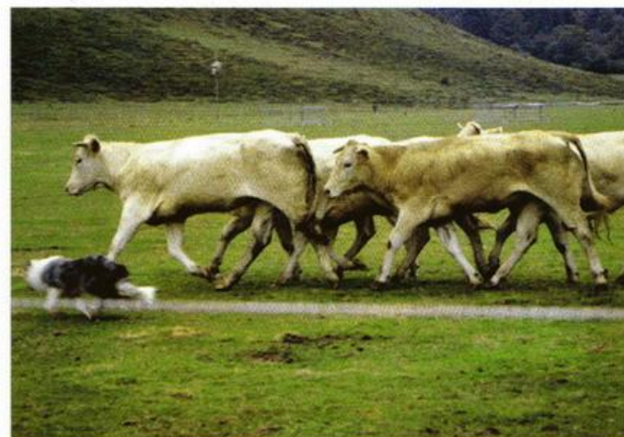
C'est au chien à s'adapter au troupeau et non l'inverse !

↳ Le paradoxe des paradoxes; Des populations de chiens utilitaires sélectionnées de manières empiriques et draconiennes nous sont parvenues au travers des siècles, et l'homme dans son infinie humilité( centre du monde) qui ne trouve plus de chemin entre l'excès de sa puissance qui guide le résultat et son impuissance à regarder les choses telles qu'elles sont sans son intervention.